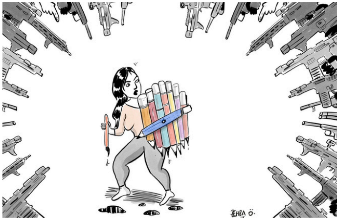
Zehra (Turquie) - Cartooning for Peace

En parallèle de la diffusion, des débats en ligne permettront de prolonger la réflexion, avec un focus sur le sourcing, le fact-checking et la lutte contre les fake news.