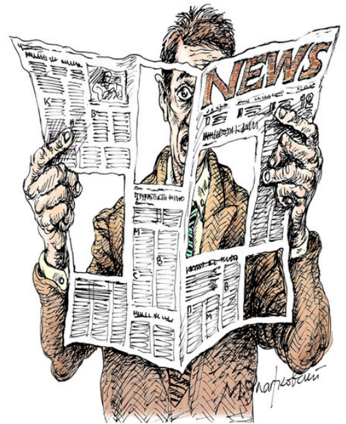
Zlatkovksy (Russie) - Cartooning for Peace

L'objectif de la campagne CARICARTOONS : éveiller les consciences et transmettre des messages forts et universels, accessibles en plusieurs langues.