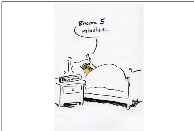
Trophée Presse Citron Étudiant May, École Estienne, DNMADe Designer Graphique et numérique, 1 ère année