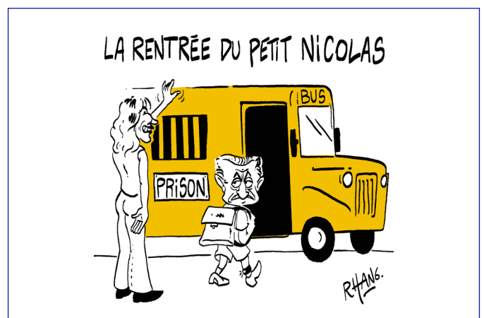
Trophée catégorie Yuzu Rhang, Université Libre de Bruxelles