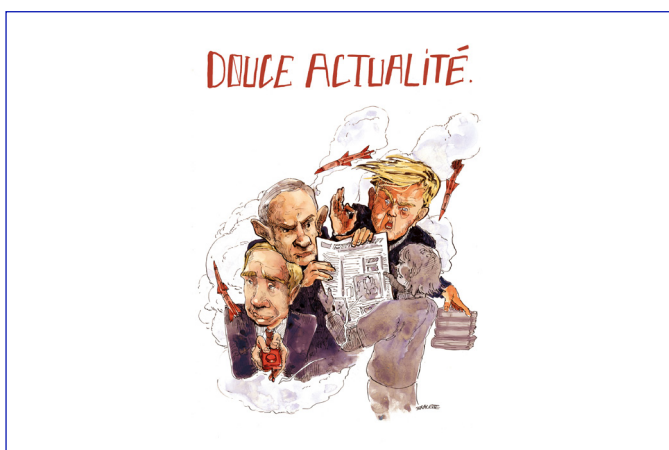
Prix auquel vous avez échappé Jouflette, Esa Saint-Luc Bruxelles