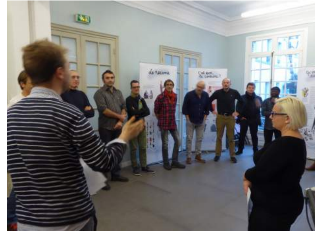
1ère formation des dessinateurs de presse à Paris Décembre 2016

En juin 2018, Cartooning for Peace organise sa première journée de bilan autour des dessinateurs de presse préalablement formés. Cette journée a permis de partager les expériences de l'année en école et en prison et d'actualiser les modes d'interventions des dessinateurs.