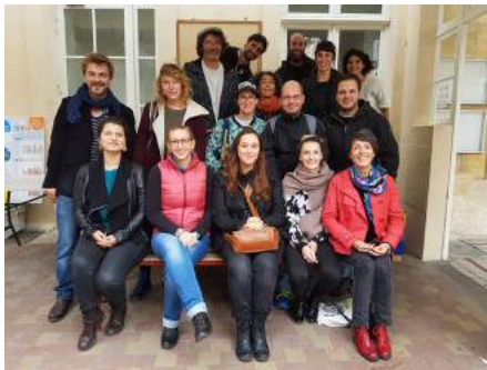
Formation des animateurs bordelais Septembre 2017