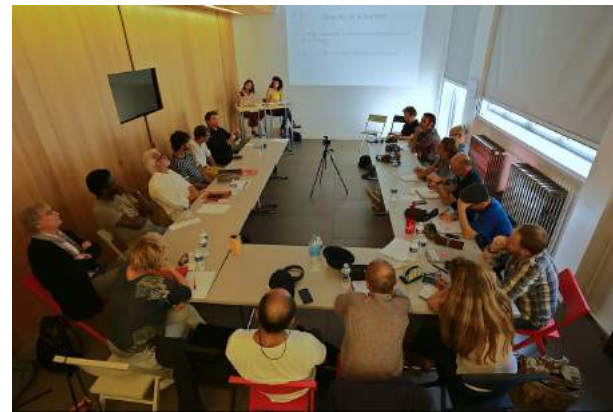
Journée de restitution des dessinateurs de presse français Juin 2018