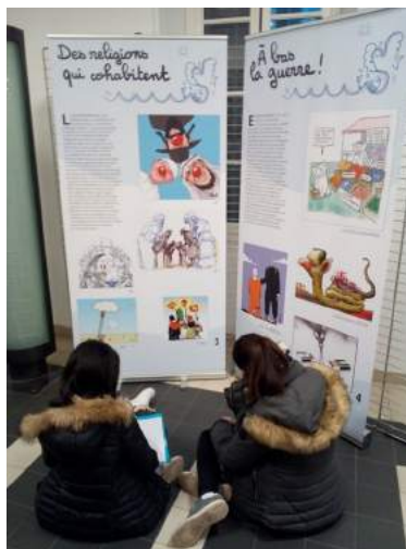
Elèves du lycée Thiers à Marseille Avril 2017

Ces chiffres ont quasiment doublé par rapport à l'année précédente : en 2016/2017, 80 ateliers étaient organisés dans les écoles et 25 en prison.