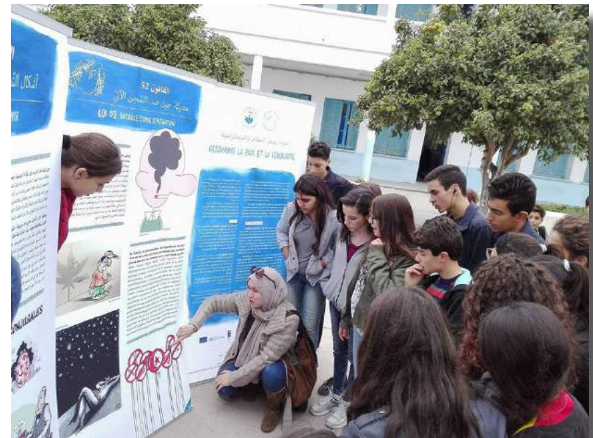
Découverte de l’exposition au collège Ali Belhaouane à Kelibia (Tunisie) Novembre 2017