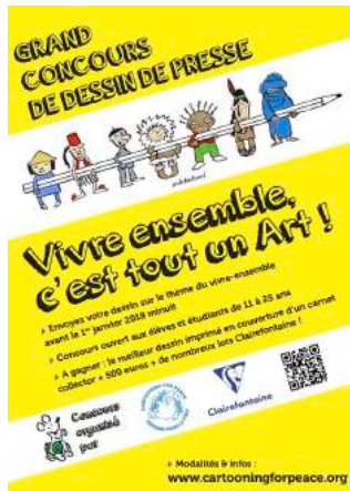
Affiche du concours CFP/ Clairefontaine 2017/2018

En 2017, Cartooning for Peace et Clairefontaine se sont associés pour proposer un grand concours de dessin de presse . Ouvert aux élèves et étudiants de 11 à 25 ans, le concours a pour thème « Vivre ensemble, c'est tout un Art ! ».