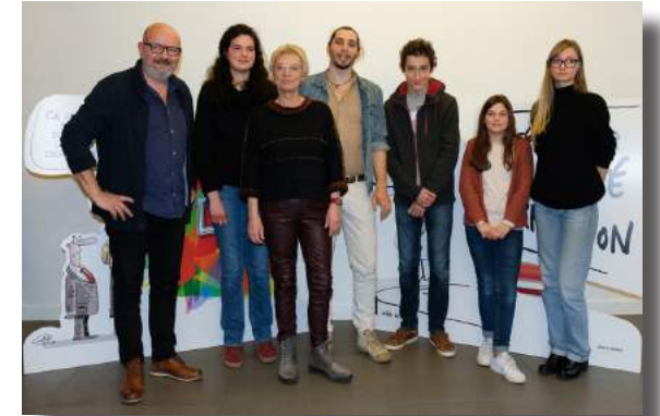
Les gagnant·e·s du concours Mars 2018