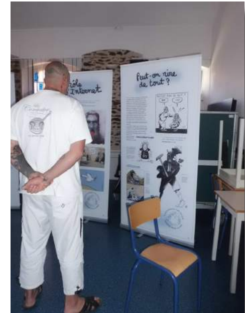
Visite d'une exposition à la maison d'arrêt de Laval en 2017.

En 2018, Cartooning for Peace organise un « Tour de France des DISP » afin de rencontrer les référents culturels et les coordinateurs culturels des SPIP. Cette démarche permettra d'évaluer l'impact auprès des détenus des kits pédagogiques et des rencontres avec les dessinateurs de presse.