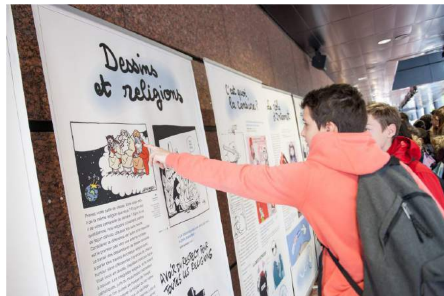
L'exposition “Dessins pour la paix” au collège de Souffelwersheim - Mars 2017

Le groupe “Réseau pédagogique Cartooning for Peace” est dédié aux enseignants travaillant autour des kits pédagogiques de l'association. Il permet de partager les bonnes pratiques mises en place par les enseignants et de diffuser les actualités pédagogiques de l'association.