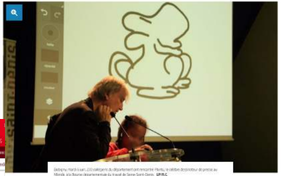
Bobigny, mardi 3 avril. 230 collégiens du département ont rencontré Plantu, le célèbre dessinateur de presse au Monde, à la Bourne départementale du travail de Seine-Saint-Denis. L'IPRC.

Le célèbre dessinateur de presse est venu à la rencontre de 230 collégiens du département. La caricature des religions a notamment suscité des réactions chez le jeune public.